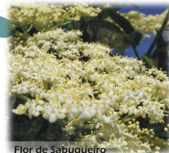
Flor de Sabugueiro

residente nas proximidades. Deixando para trás Campo de Jales, pertencente à freguesia de Vreia de Jales, cujo desenvolvimento era sustentado pela indústria mineira, avançamos entre os campos de cultivo até chegarmos às primeiras casas de Alfarela de Jales, ponto em que atravessamos a Estrada Nacional 212. Adiante, subimos um caminho que nos conduzirá ao local onde teve início este percurso.