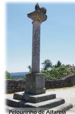
Pelourinho de Alfarela